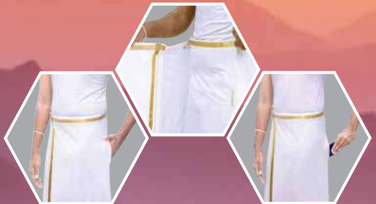
DHOTI WITH POCKET